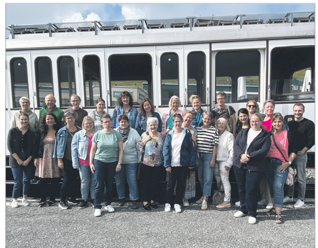
Das gesamte Team und der Vorstand der Spitex Regio Arth-Goldau bedanken sich für das Interesse und die Unterstützung.

Alles Weitere zum Jahr 2026 lässt sich an der Generalversammlung im April 2027 erfahren – die Einladungen erfolgen wie gewohnt.